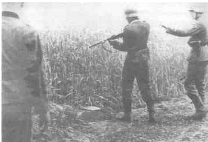
Патрульный полевой жандармерии расстреливает подозреваемого

городах и придорожных деревнях немецкий контроль казался прочным; однако чем дальше от городов, тем реже можно было встретить немецкие гарнизоны. Несколько де-