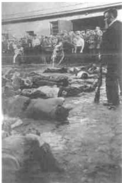
Гитлеровцы охотно устраивают средневековые еврейские погромы. И. Сталин, 6 ноября 1941 г.

В последние дни сентября сорок первого года на всех киевских заборах висели небольшие объявления сразу на трех языках. По-русски, по-украински и по-немецки приказ оккупационных властей звучал по-разному, но смысл был одним.