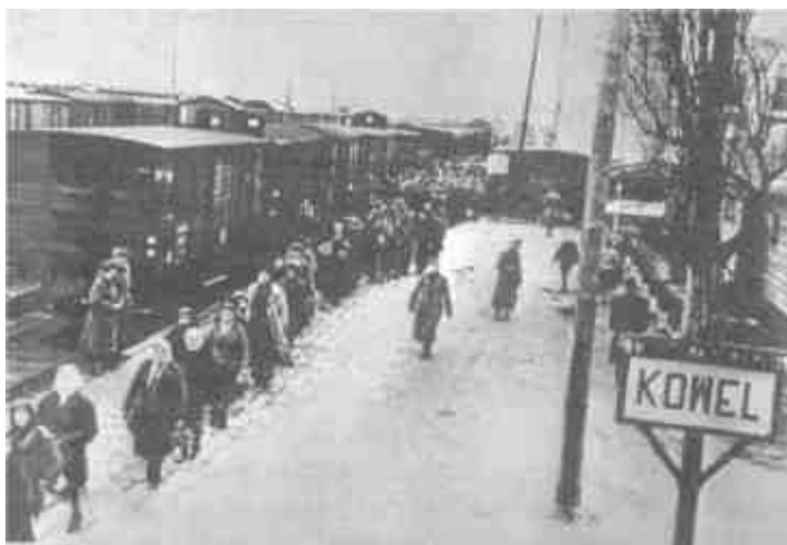
Советские граждане под охраной немецких солдат на станции Ковель перед отправкой в Германию