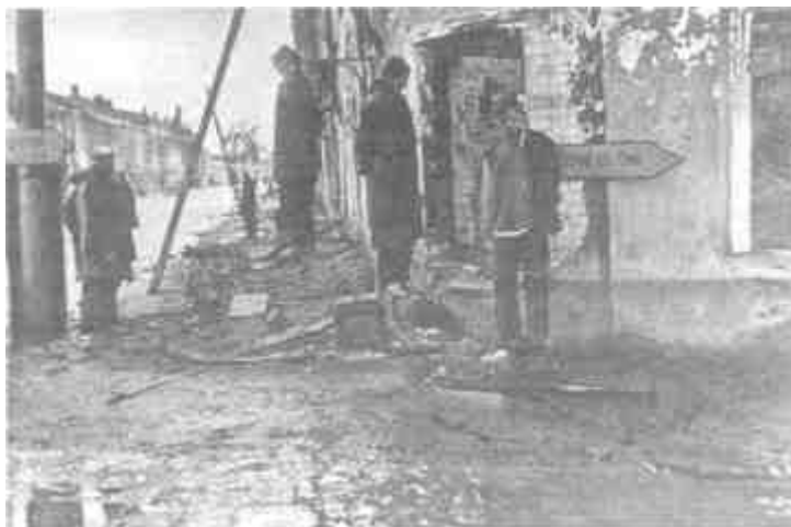
Заложники, повешенные в Старой Руссе

прост: он заключался в проведении массовых акций уничтожения.