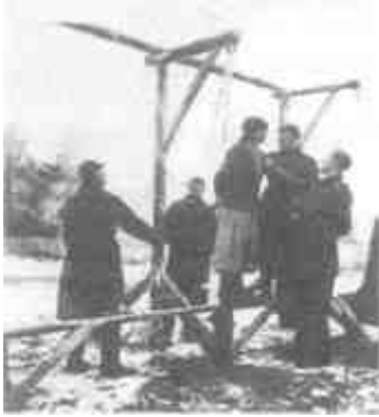
Борьба с партизанами в действии