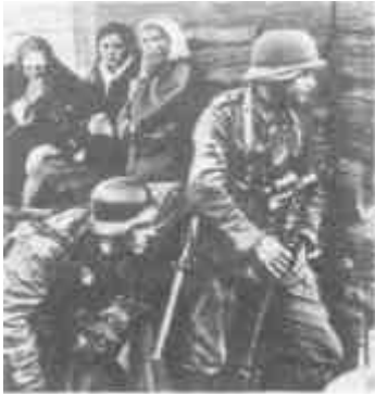
Немецкие войска вступают в захваченную деревню. С ужасом смотрят на них крестьянки....

1 МНП. Вар. 1. Т. 5. С. 95-96; Вар. 2. Т. 3. С. 219—220; Ни давности, ни забвения... С. 28.