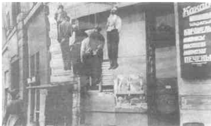
Мирные жители, повешенные гитлеровцами

дант. Дети отпрянули, но немец успел схватить маленького за ручки и со всего размаха бросил в придорожную канаву. Сломал малышу руку» 1 .