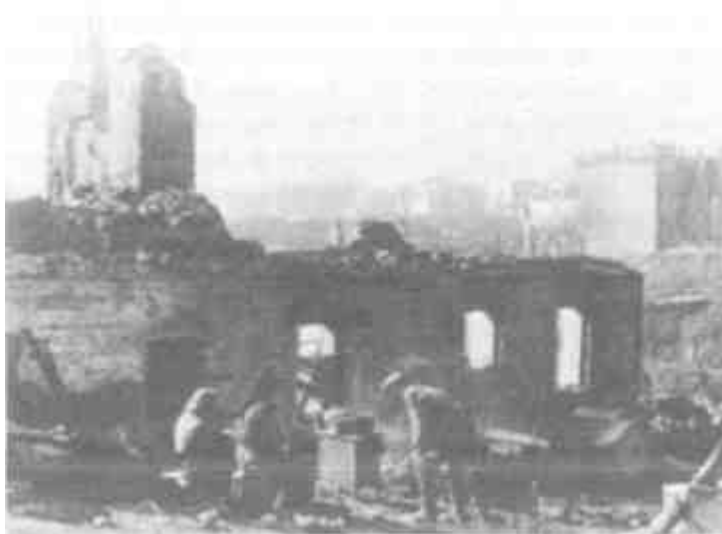
Жители возвращаются в освобожденный Смоленск, сентябрь 1943 г.

ему руки и сломали в костях, а потом застрелили его из нагана в ухо. И дом спалили...» 1