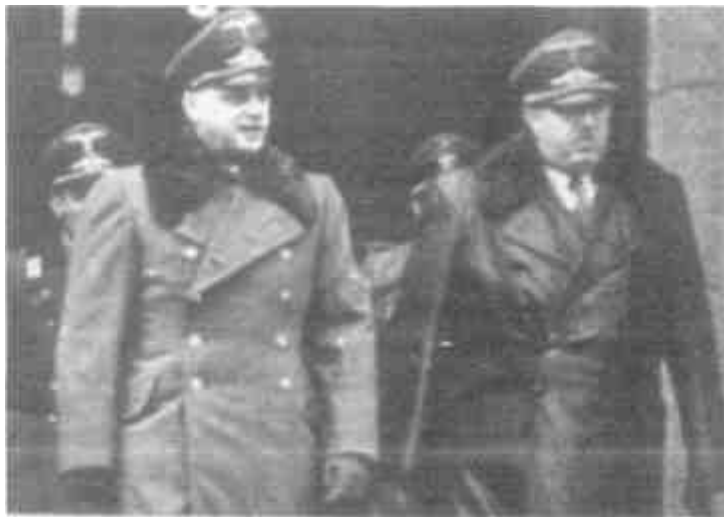
Рейхсминистр оккупированных восточных территорий Альфред Розенберг (слева) и рейхскомиссар Остланда Генрих Лозе

К ним присоединяется Борман. Разговор между ними ведется о «черном рынке» в Германии, который принял широкие размеры.