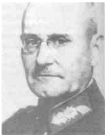
Генерал Франц Гальдер предвосхитил указания фюрера в разработке «преступных директив»

применением любых — без разбора — средств предпослана здесь как нечто само собой разумеющееся» 1 .