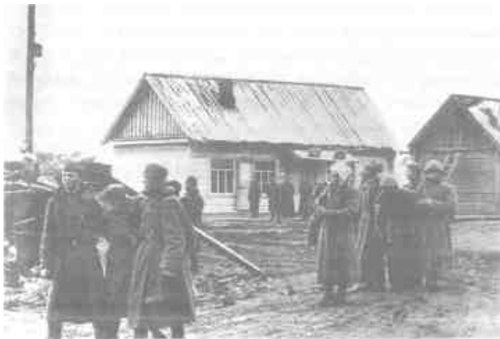
Группа советских военнопленных в одном из населенных пунктов

палками, звучала команда: «Все бегом!» Толпа бежала, и в это время на нас обрушивались удары. Прогон один-два километра, и раздавалось: «Стой!» Задышающиеся, разгоряченные, обливаясь потом, мы останавливались, и нас в таком состоянии держали на холодном, пронизывающем ветру по часу под дождем и снегом. Эти упражнения повторялись несколько раз, в результате на этап выходили самые выносливые, многие наши товарищи оставались лежать, звучали одиночные сухие выстрелы, это добивали тех, кто не смог подняться» 1 .