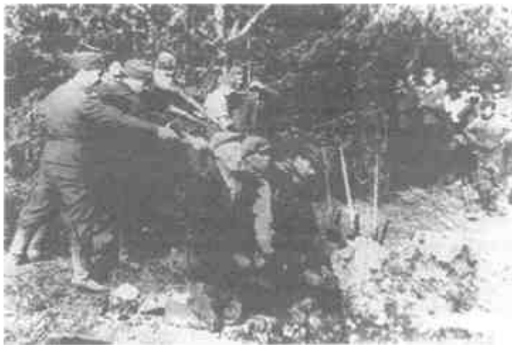
Нацисты расстреливают мирных жителей в Каунасе

групп армий назначались лично фюрером и действовали в соответствии с его директивами, переданными через начальника штаба ОКВ. Их обязанности заключались в обеспечении безопасности оккупированной территории 1 .