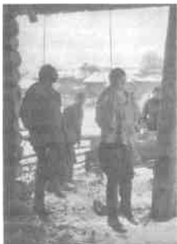
Казнь пленных красноармейцев

среди тыловигов. Впрочем, максимум, на что они могли рассчитывать, — это внеочередное звание и «Восточная медаль». Кадровые каратели получали гораздо больше. 14 ноября 1941 года инспектор концлагерей обратился к комендантам лагерей с просьбой «по возможности быстро сообщить обо всех членах СС, участвовавших в эзекуциях, для награждения их крестом заслуг II класса с мечами». Подобное намерение вызвало недоумение даже у некоторых комендантов лагерей: давать боевые награды за работу палача! Однако вскоре отличившихся палачей стали награждать не только боевыми наградами, но и предоставлением отпуска и поездкой домой за государственный счет 1 . Большая роскошь по военным временам!