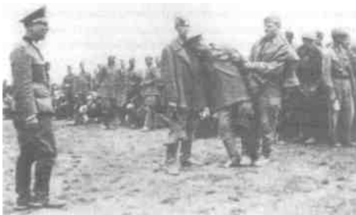
В лагерях военнопленных проводилась селекция. Всех подозрительных расстреливали

Подлежащих ликвидации было так много, что сотрудники айнзатцгрупп и охрана лагерей не справлялись; к экзекуциям привлекали солдат из дислоцировавшихся