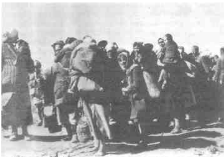
Колонна жителей одного из населенных пунктов в районе Сталинграда перед отправкой в Германию

беспокойство, ибо среди населения наблюдается крайне отрицательное отношение к от-