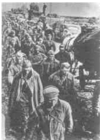
Летом сорок первого в руки к нацистам попали сотни тысяч советских военнослужащих