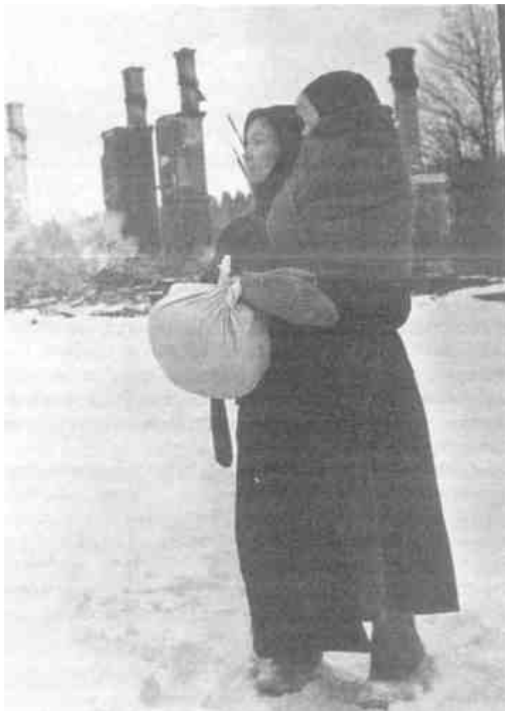
Женщина возвращается к своему дому, разрушенному нацистами

ления места сомнениям не осталось; их место заняли ужас, гнев и ненависть к нацистским палачам. И еще — глубочайшее изумление. «История донесла до нас,