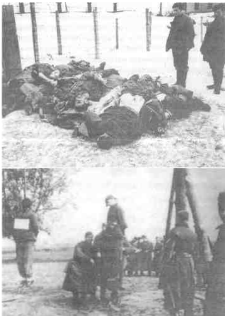
Советские военнопленные, уничтоженные нацистами

только один раз в сутки жидкую баланду. Из-за голода и болезней в лагерях была очень большая смертность» 1 .