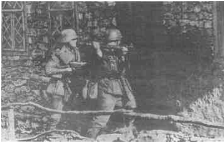
Солдаты вермахта врываются в дома. Там, где было заперто, -убивали всех.

Всего в первые дни после взятия Львова было убито более четырех тысяч человек. Их тела, собранные в одном месте, могли видеть все горожане. «У стен домов были сложены изуродованные трупы, главным образом женщин. На первом месте этой ужасающей «выставки»