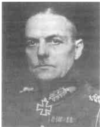
Фельдмаршал Герд фон Рундштедт призывал к уничтожению трети населения оккупированных советских земель. Его слова не расходились с делом

щихся, саботажников, евреев, а также безоговорочному подавлению любого активного и пассивного сопротивления» 1 . 23 мая она легла на стол Кейтеля и была немедленно утверждена.