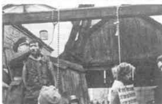
Казнь минских подпольщиков 26 октября 1941 года

фронте это было тривиальным мероприятием, не вызывавшим у немцев особых эмоций. К концу сорок первого счет сожженных карателями деревень шел на сотни.