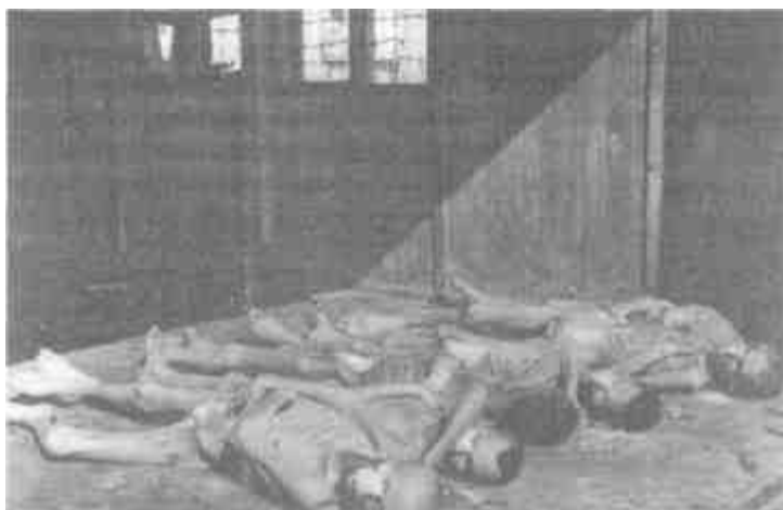
Трупы узников русского лагеря № 344 в городе Ламсдорфе

Когда хоронят восточных рабочих, об их смерти составляют свидетельство. Порядок прежде всего! В последнем лагерном документе уничтоженных людей