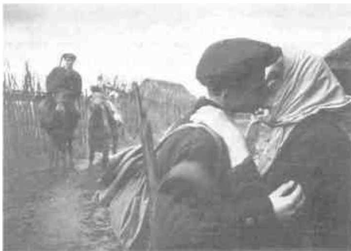
Колхозница отправляет своего сына в партизанский отряд

Впрочем, не меньшую радость при виде партизан испытывали и русские, украинские, белорусские крестьяне. Даже там, где не было партизанских краев, где вроде бы существовала оккупационная власть, не приходилось сомневаться, на чьей стороне симпатии населения. «Русские к немцам и венграм относятся с неприязнью, по меньшей мере сдержанно, к партизанам отношение очень дружественное, — пишет в отчете, датированном 7 июля 1942 года, командир 703-го охранного батальона. — Большая часть их в партизанах; даже жен-