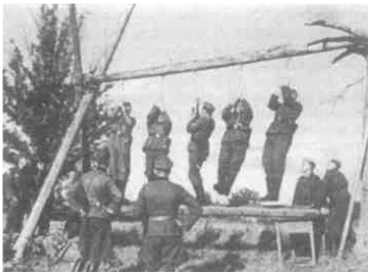
Порядок прежде всего: перед казнью нужно проверить прочность виселицы

Верховное командование вермахта требовало «совершенно необычайной жестокости»; действия частей по охране тыла и вправду ужасали даже некоторых немецких офицеров. Проезжая через Старую Руссу, армей-