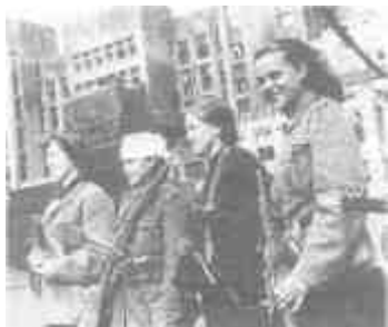
Советские партизанки в освобожденном Минске

Удачно начавшееся наступление Рокоссовского прекратила оттепель. Завязнув в болотистой белорусской местности, советские войска остановились до лета.