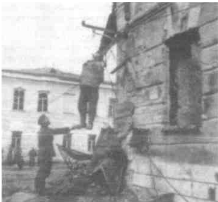
Солдаты вермахта с удовольствием фотографировались на фоне своих жертв

от них во время массовых акций уничтожения. Их мораль и выдержка сохранились потому, что каждому было разъяснено политическое значение этих мер» 1 .