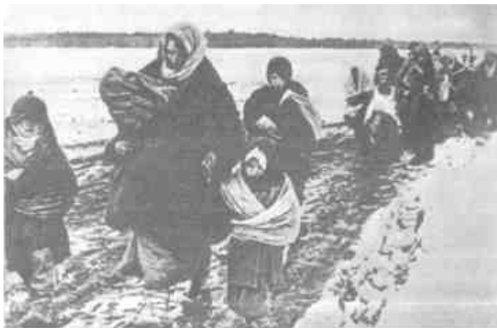
Толпы женщин и детей бродили по бездорожью в поисках куска хлеба и крыши над головой

свете горящих изб. Это немцы, отступая, жгли за собой деревни. «Ночью было светло как днем», — вспоминали потом солдаты, а летописец группы армий «Север», описывая события той страшной зимы, не без гордости заметил: «Советы получили во владение мертвую местность» 1 .