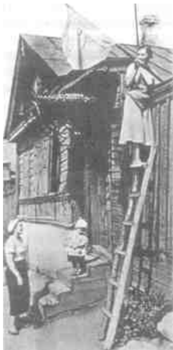
Красный флаг над домом в освобожденном Орле - символ победы и свободы

и жгли. Убегая, они убили последнюю партию, сожгли и, спеша, не дожгли. Я видел полуобугленные тела — голову девочки, женское тело и сотни, сотни трупов. Я многое